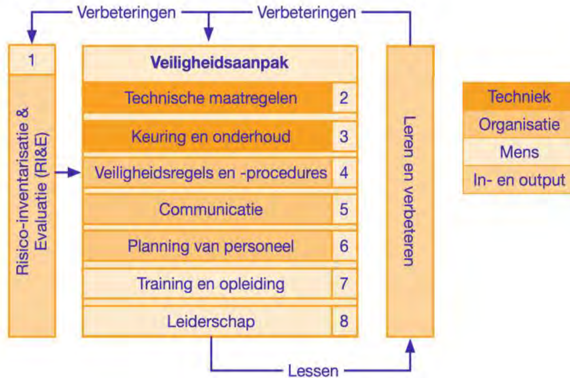
Figuur 5.4 De negen stappen om veiligheid te organiseren en te verbeteren